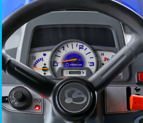
Nowoczesna deska rozdzielcza ze wskazaniami najważniejszych parametrów.