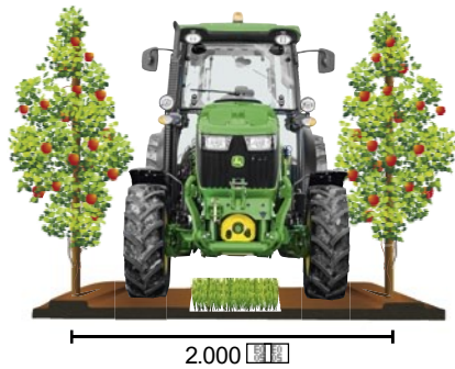
id 2000 voor boomgaarden en pergola's