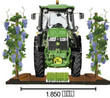
Voor laaghangende boomgaarden en pergola's