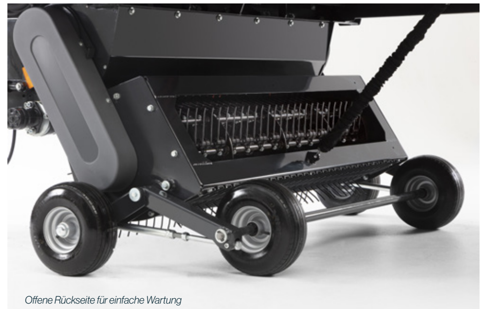
Offene Rückseite für einfache Wartung