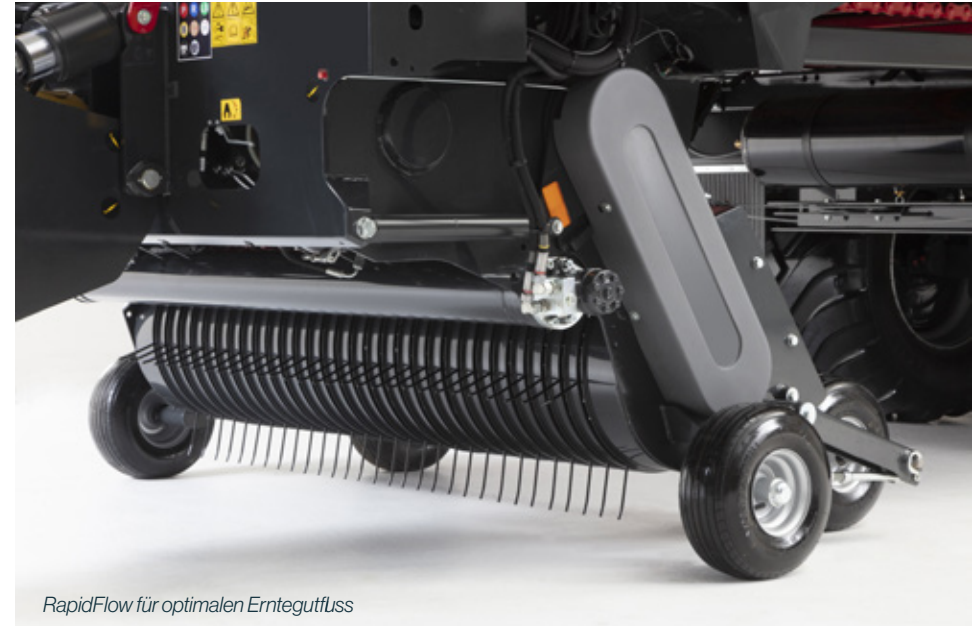
RapidFlow für optimalen Erntegutfluss

Die Kombination der einzigartigen Merkmale unseres Konzepts mit dem Schuitemaker Trailing Pick-up, der RapidFlow-Aufnahmewalze und dem leistungsstarken und ruhigen PowerRotor macht das Laden noch einfacher, wirtschaftlicher und effizienter als je zuvor. So erzielen Sie mühelos ein optimales Ergebnis.