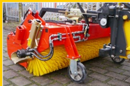
Два больших направляющих ролика 250 мм x 50 мм