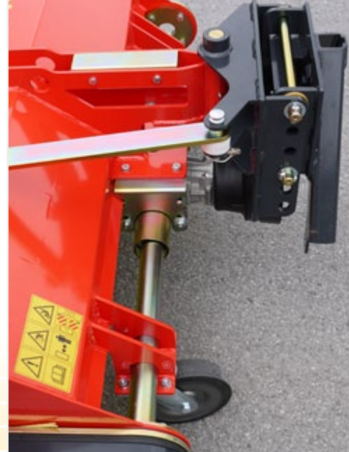
Привод механический (опционально гидравлический)