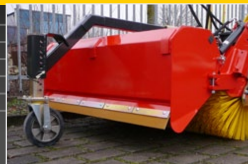
Серийно гидравлическое опорожнение сборника, третье опорное колесо в качестве опции