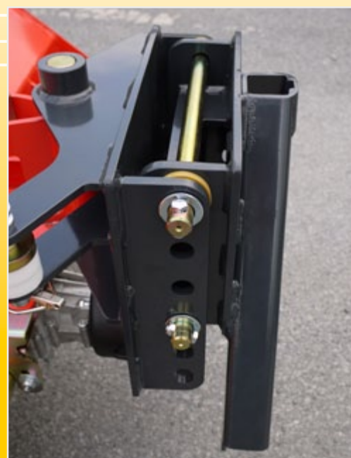
Оптимальное согласование с дорогой благодаря 3D-регулированию дорожного просвета