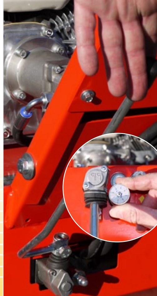
Управление через систему тяг и рычагов и бесступенчатый привод ходовой части