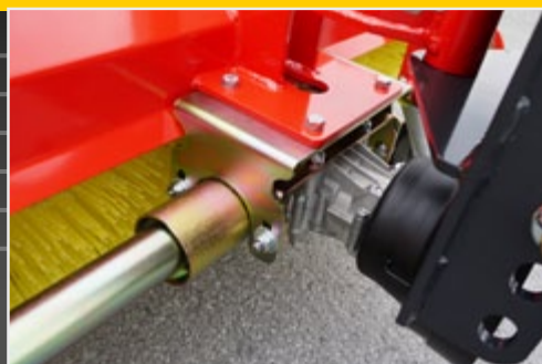
С возможностью изменения частоты вращения, направления вращения и расположения редуктора