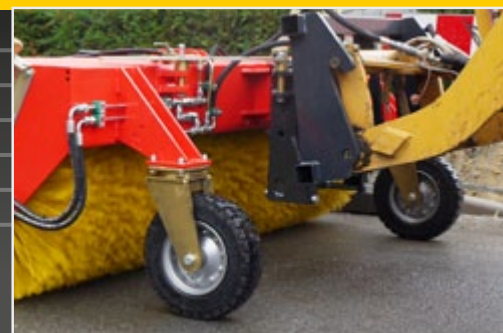
Два больших направляющих ролика 400 мм x 110 мм