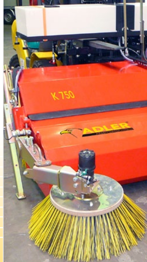
Боковая метла и бак для воды на 240 л в качестве дополнения

Мы разрабатываем и производим в Германии