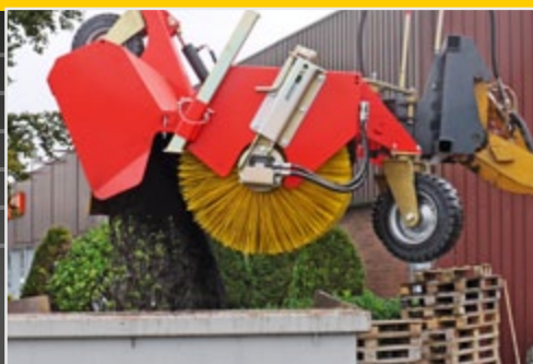
Гидравлическое опорожнение сборника