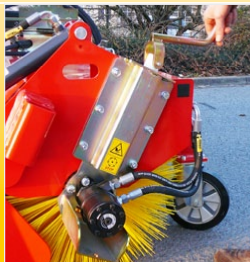
Бесступенчатая регулировка щетки