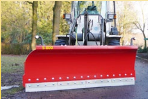
Серия S с навешиванием на колесный грузчик