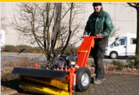
Использование НК 5.5 – чрезвычайно маневренно