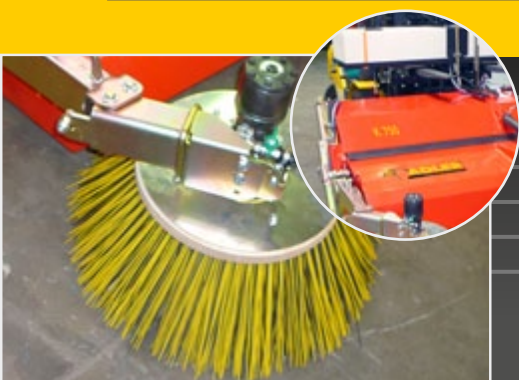
Боковая метла и водоразбрызгиватель в качестве опции