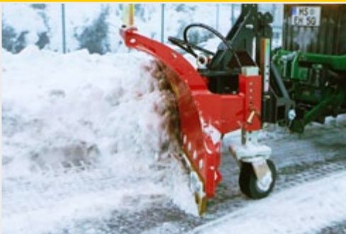
Снегоочиститель с отвалом толщиной 6 мм