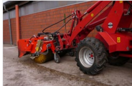
Использование K 600 с приусадебным погрузчиком