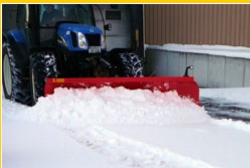
Ширина захвата от 135 см до 330 см