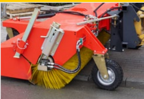
3D-регулирование дорожного просвета – оптимальное согласование с землей на любом рельефе