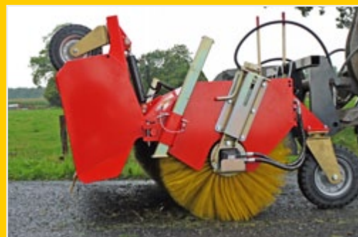
Серийно режим простого подметания и диаметр щетки 750 мм