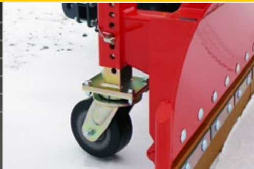
Регулируемые по высоте опорные колеса