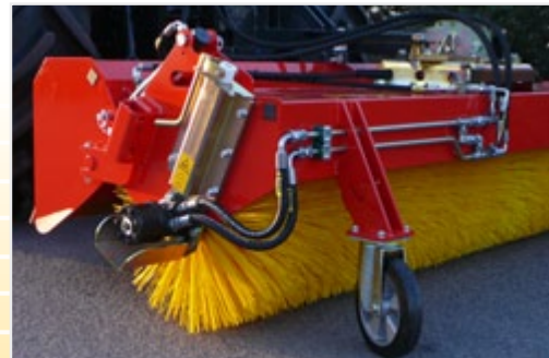
K 600 с режимом простого подметания и с бункером