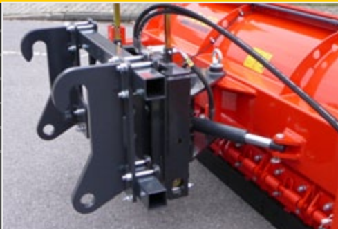
Универсальное крепление с гидравлическим устройством отклонения (начиная с S 800 с двумя гидравлическими цилиндрами)