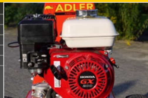
Двигатель Honda GX 200