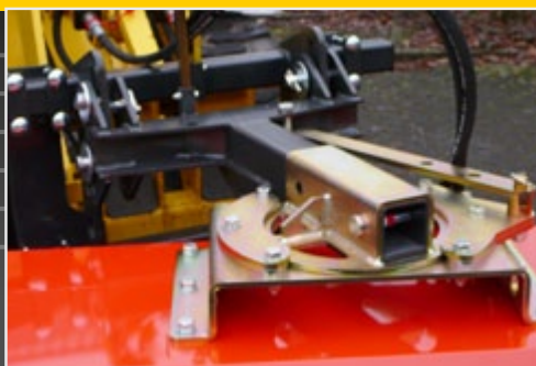
Система крепления с регулированием дорожного просвета и указателем высоты