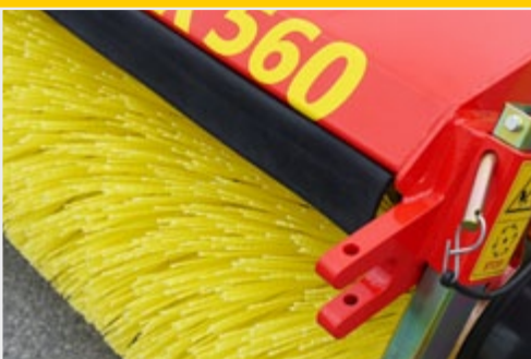
Серийно со стояночными опорами и подготовкой для крепления сборного резервуара