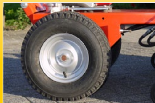
Большие приводные колеса