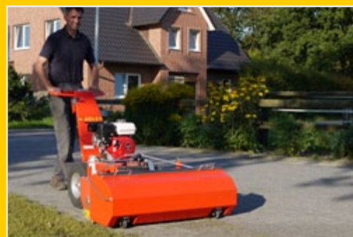
Уборка со сборником