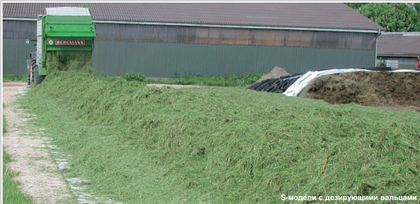
S-модели с дозирующими вальцами