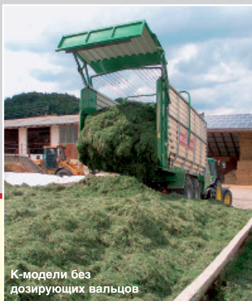
K-модели без дозирующих вальцов

◀ Без компромиссов стабильно сконструированный задний борт гидравлически открывается до самого верха для быстрой и абсолютно безприпятственной разгрузки.