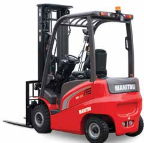
4 RUOTE 48 VOLT