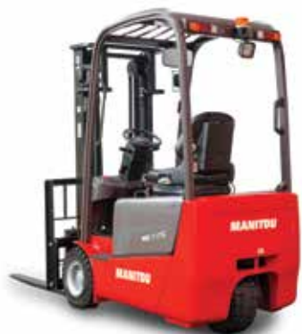
3 RUOTE 24 VOLT