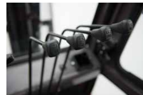
Leve idrauliche di serie