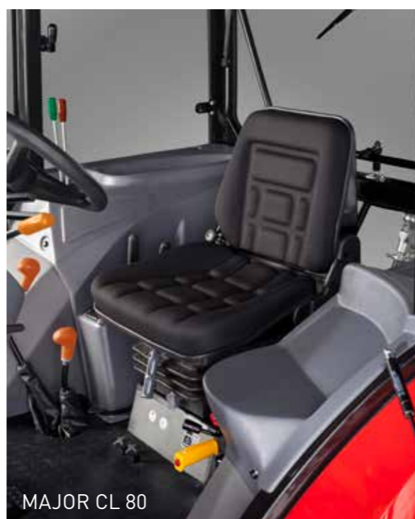
MAJOR CL 80

De cabine is comfortabel en ontworpen met aandacht voor het praktische gebruik. Veel ruimte en een ergonomische plaatsing van de bedieningsorganen vergemakkelijken het werk van de bestuurder. De cabine heeft een dakluik om het werk met een voorlader te vergemakkelijken. De Major cabine kan optioneel worden uitgerust met airco.