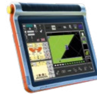
K-Monitor Pro 12"