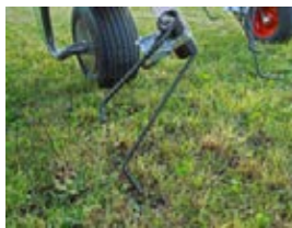
De 7,5 cm lange haak van de Fendt Performance-tand pakt het gewas trekkend op.