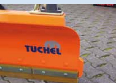
Abkantung im seitlichen und oberen Schildbereich