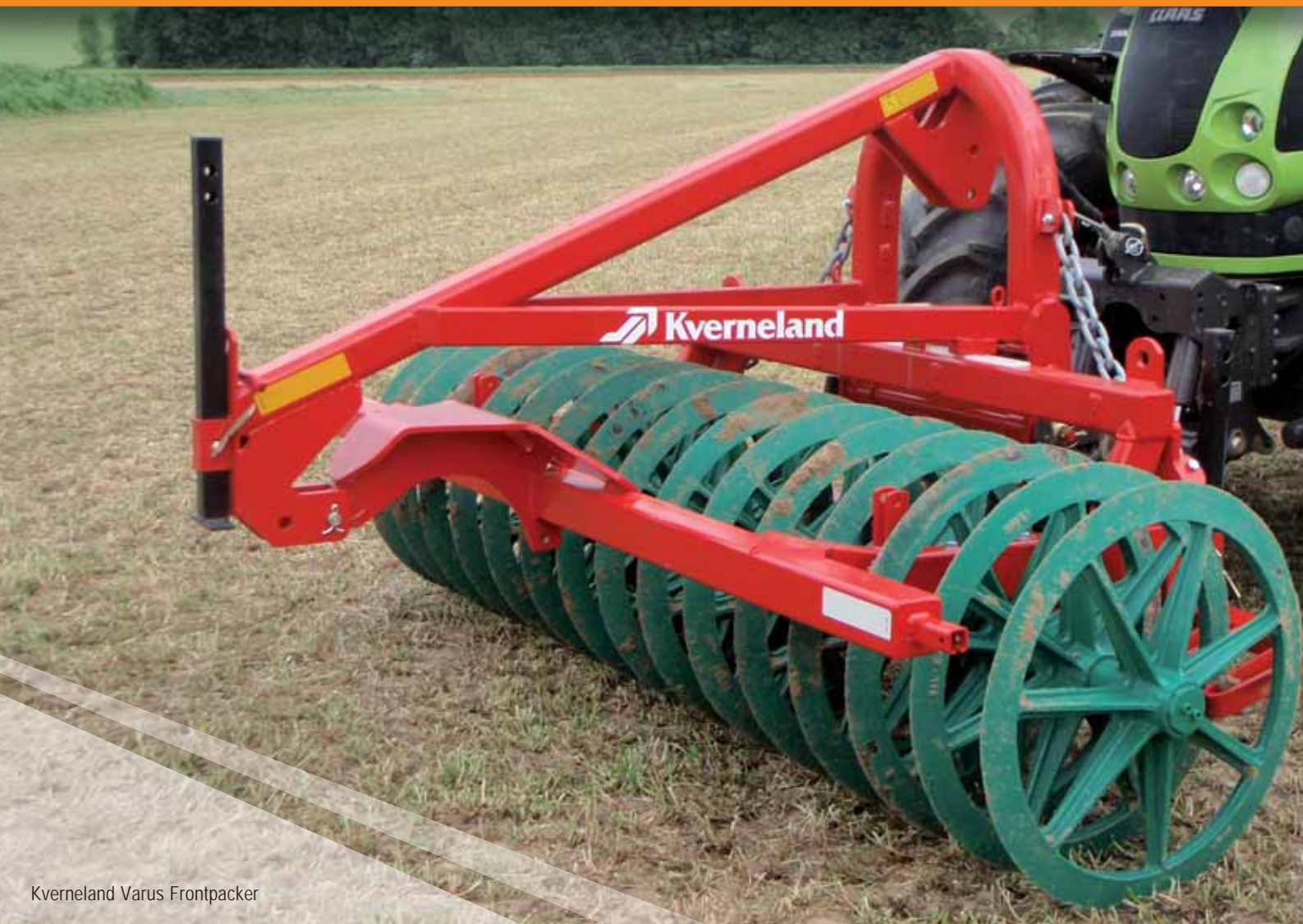
Kverneland Varus Frontpacker