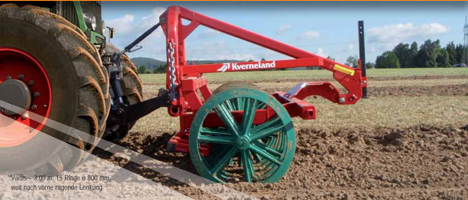
Varus – 3,00 m, 15 Ringe ø 800 mm, weit nach vorne ragende Lenkung