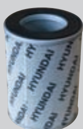
Filter voor hydraulische olie (1000 uur)

De wielladers van de 9-serie zijn voorzien van spatborden voor- en achteraan en van spatlappen vooraan en achteraan (optioneel) om ervoor te zorgen dat er minder vuil op de cabine en het machineframe terecht komt.