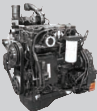
QSB 4.5-motor van Cummins

Low-modus: korte afstanden en snel laden Medium-modus: algemeen laadwerk High-modus: laden op een helling