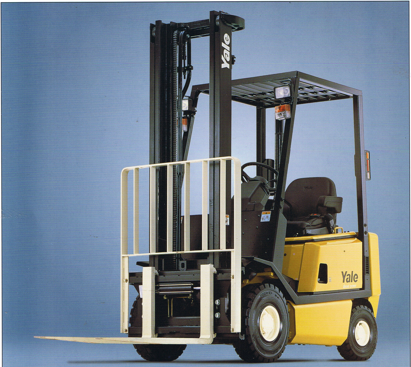
Der dargestellte Stapler enthält Sonderausstattungen.