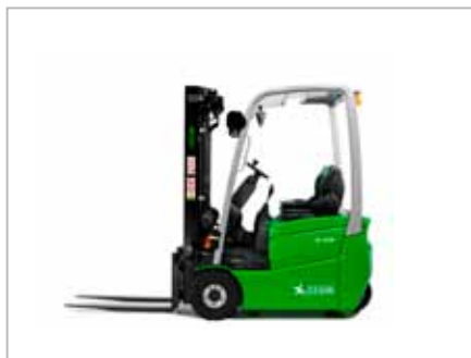
CESAB B315 - B320