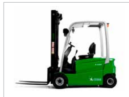
CESAB B415 - B420