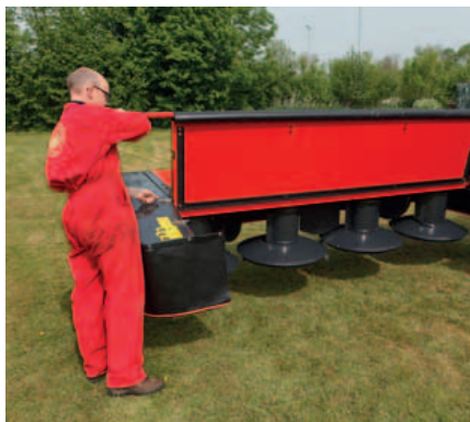
De complete voorkap kan omhoog geklapt worden voor goede toegang naar de trommels.