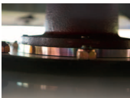
432F heeft standaard variabele maaihoogteverstelling.