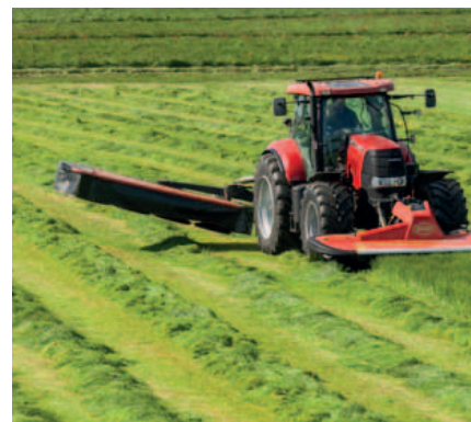
Ruime kopakkerstand waardoor zwaden niet worden losgereden tijdens draaien op de kopakker.