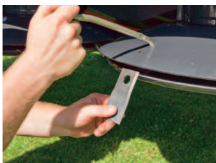
Messen worden gemakkelijk gewisseld met een speciale hendel. Eenvoudig naar beneden drukken en de messen zijn ontgrendeld.