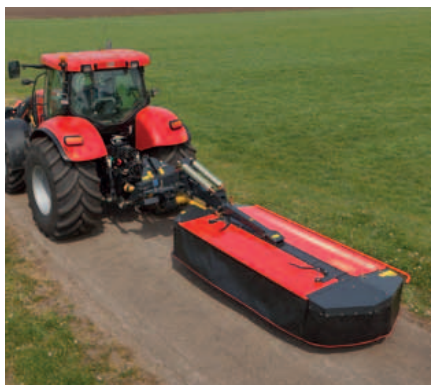
EXPERT 431 wordt in een horizontale positie achter de trekker getransporteerd.

Standaard is de EXPERT 431 voorzien van een hydraulische uitbreekbeveiliging. Bij aanraking met een obstakel zal de gehele maaieunit naar achteren uitwijken. Door druk op de cilinder te zetten, komt het werktuig automatisch terug in werkstand.