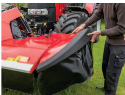
Buitenste beschermkappen worden eenvoudig opgeklapt voor smal transport.