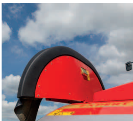
De nieuwe generatie FlexProtect beschermkappen, gemaakt van flexibel en duurzaam polyethyleen, kunnen tegen een stootje en absorberen piekbelastingen.