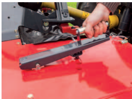
De zwadwielen zijn eenvoudig en snel te verstellen vanaf de bovenzijde van de maaier.