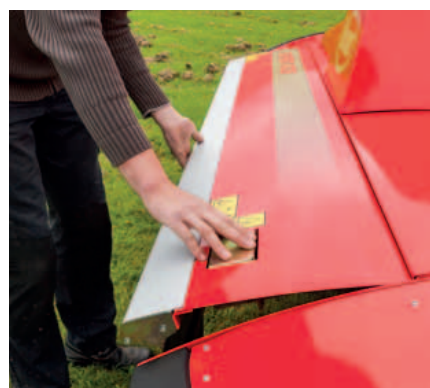
Alle hendels die dagelijks gebruikt worden zijn duidelijk zichtbaar en ergonomisch ontworpen voor maximale gebruiksvriendelijkheid.