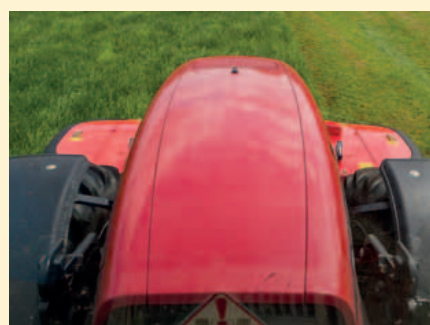
Dankzij het speciale ontwerp van de maaier een uitstekend zicht op het werk.