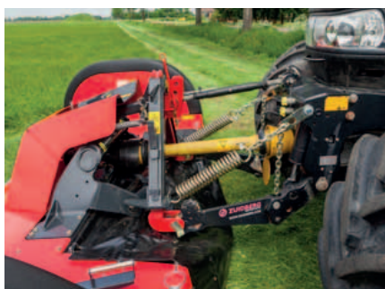
Het ontwerp van de geïntegreerde pendelboks resulteert in perfecte bodemvolgving.