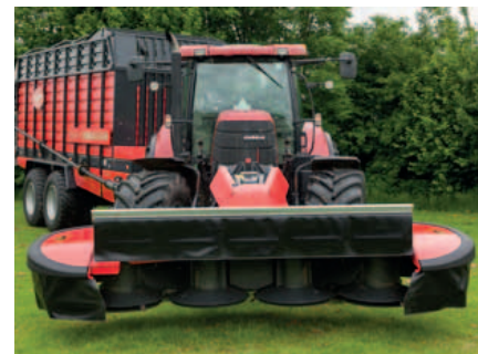
De kap aan de voorzijde kan helemaal geopend worden voor onderhoudsdoeleinden.