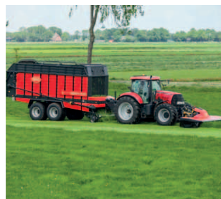
EXPERT 432F is o.a. ideaal voor stalvoeren.

Het betrouwbare ontwerp, bestaande uit een robuuste V-snaar aandrijving en automatische spanner, reduceert (piek) belastingen op de rest van de aandrijving.