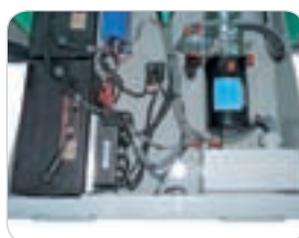
Wartungsfreundliche Bauteile mit rationellem Einbau.