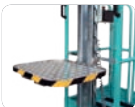
Rutschsichere Ablageplattform; in 8 Positionen verstellbar.