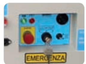
Bodensteuerpult, intuitiv und geschützt vor zufälligen Stößen.