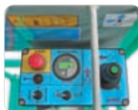
Robuster, einfacher und intuitiver IP65 - Plattformsteuerpult.