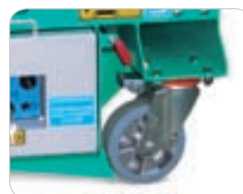
Lenkrollen Verriegelung für Geradeaus-Richtungsstabilität.