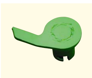
Cabezal agitador para el abono granulado