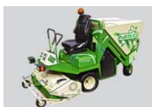
Profihopper: segadora y escarificadora con dispositivo de recogida