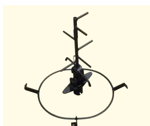
Agitador de varillas para arena y sal