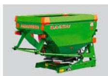
Esparcidora de abono de dos discos ZA-XW, 500 l