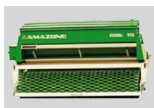
Combinación de siembra ancha para herbáceas