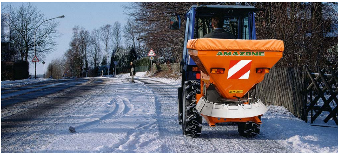
Esparcido preciso de arena, sal o gravilla también en caminos peatonales y carriles bici.

Reservado el derecho a introducir modificaciones técnicas.