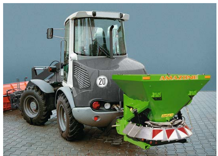
E+S SH: La transmisión de tipo hidráulico permite por ejemplo el uso con una pala cargadora de ruedas.

La posibilidad de elegir entre la transmisión mediante toma de fuerza o tipo hidráulico permite un gran número de aplicaciones.