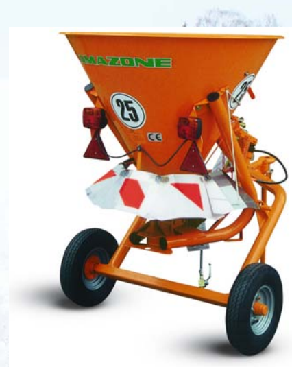
EK-S 260 con bastidor e iluminación (opcionalmente también con certificado del TÜV).