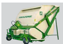
Segadora de césped Groundkeeper con descarga en elevación