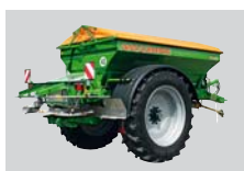
Esparcidora de arena para grandes superficies ZG-B