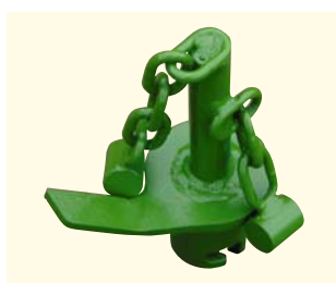
Agitador con cadena para la mezcla de gravilla y sal