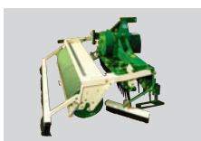
Máquina para el mantenimiento de pistas duras