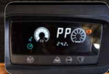
Ecran multifonction clair permettant d'ajuster les paramètres de conduit ainsi que le diagnostic chariot