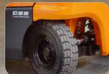
Déplacements sécurisant grâce au contrepoids arrondi