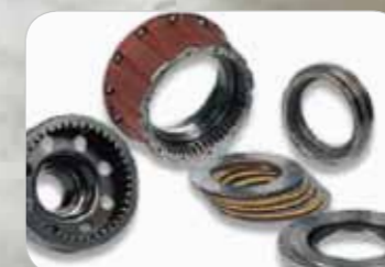
Freins à disque à bain d'huile

Les chariots élévateurs électriques Série 7 de Doosan possèdent l'étanchéité et la sécurité requise pour l'usage extérieur. Les nouveaux contrôleurs scellés sont conformes à la norme IP65 et les moteurs répondent au type fermé IP43 ; tous les connecteurs et câbles connexes sont étanches au silicone. Cela signifie qu'ils sont totalement protégés contre « la poussière, les débris et les liquides » et conviennent aux applications extérieures.