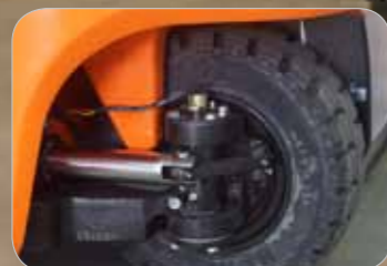
Angle de rotation optimisé pour minimiser le rayon de giration