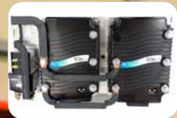
Fonctionnement stable et fiable Variateur Curtis indice de protection IP65

Chaque fois que l'opérateur quitte son siège, le frein de stationnement électromagnétique du chariot est activé automatiquement avec une fonction de maintien en rampe illimitée. Des réglages de performance permettent à l'opérateur d'optimiser les performances de la machine pour ses applications spécifiques. Le contrepoids arrondi et l'angle de rotation à 93° assure une productivité maximale même en allées étroites.