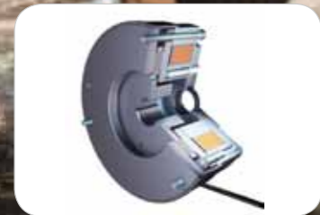
Frein de stationnement électromagnétique automatique