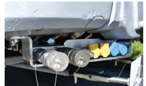
Optionale Powerline für den Anschluss von leistungshungrigem Zubehör