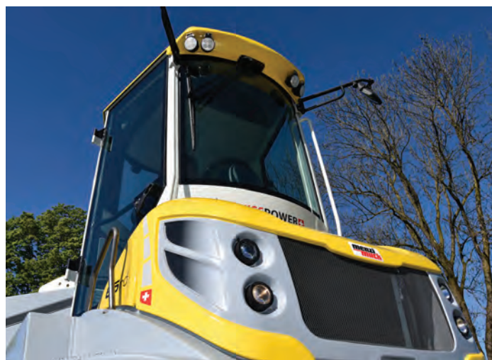
180° drehbare Kabine mit geräumigem, ergonomischem Cockpit