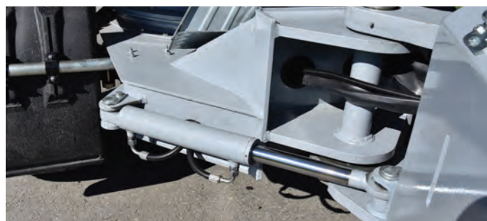
Robustes Zentralgelenk mit Knickwinkel +/- 35° und Pendelwinkel +/- 12°

Automotives Fahren, zweistufiger hydrostatischer Fahrtrieb bis 30 km/h, maximale Zugkraft 53 kN, elektronisches Fahrmanagement, Antriebsräder: MT63 18-19.5 und GL073A 335/80R20