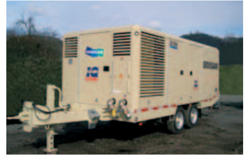
25/330 Kompressor auf StVZO Tandemfahrwerk, Ausgestattet mit Optionalem IQ System.